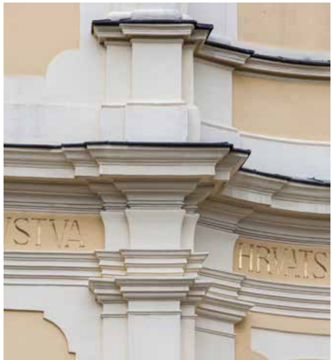
8. Pročelje crkve sv. Franje Ksaverskog, detalj

Barokna crkva građena je od 1748. do 1752. godine, glavni donator bio je kanonik Sigismund Sinersperg, uz biskupe Branjuga i Thauszya te kanonika Adama Stipanića. Nepoznati projektant ostvaruje zrelobarokno rješenje naglašeno centraliziranoga dvotravnog broda svodenoga češkim kapama, a centralnost prostornog oblikovanja naglašena je skošenim uglovima i posebno svodenim slavlukom te jednako oblikovanim dijelom nad ulazom (sl. 5). Nad kvadratnim svetištem skošenih uglova je kupola na pandantivima s visokom lanternom. U ogoljenom interijeru ističu se jastučasti kapiteli pilastara nosača broda, naglašena baza kupole s profilacijama gređa (arhitrav, prazno polje friza i istaknuti vijenac) te svjetlosni akcent koji dolazi iz lanternne (sl. 6). Prostorno-tlocrtna krivulja naglašena je i povijenom ogradom pjevališta, a u literaturi se posebno ističe konveksno-konkavno pročelje crkve, prvo takvo u Hrvatskoj (sl. 7). 49 Donji pravokutni dio pročelja čine tri polja odijeljena pilastrima, koji svojim postavom naglašavaju blagu konkavnost polja: udvojeni pilastri središnjeg dijela “prekrivaju” pod