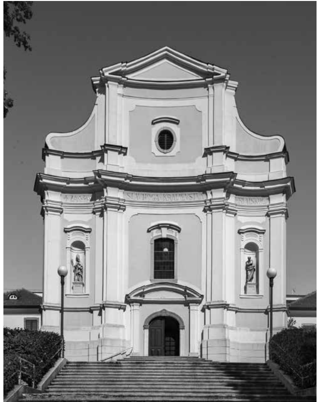
7. Pročelje crkve sv. Franje Ksaverskog (Fototeka Instituta za povijest umjetnosti)

Interior of the church of St Francis Xavier