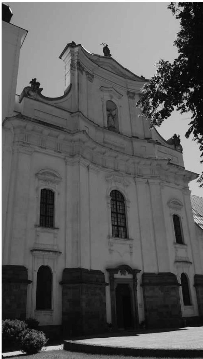
11. Pročelje crkve u Gornjem Gradu, Slovenija Front façade of the church in Gornji Grad, Slovenia

građena je od 1748. do 1752. godine – kao i isti donator, kanonik Sinersperger, ali i slične sudbine u obnovama u prvim desetljećima 20. stoljeća kada se mijenja njihov neposredni kontekst i uklopljene su u kvalitetna ostvarenja međuratne arhitekture. Vitke šesterostrane lanterne nad kupolama obaju crkava (sl. 9, 10), sa spojenim vijencima nad otvorima koji tvore treperavu bogato profiliranu liniju, još su jedan element u prilog zajedničkom podrijetlu rješenja, a vjerojatno i autorstvu; kao i povijene ograde pjevališta koje dodatno naglašavaju prostorno oblikovanje. Stoga se i podrijetlo njihovih rješenja, kao i kasnije intervencije, mogu zajedno razmatrati. Brojna pitanja ostaju za daljnja istraživanja, primjerice uloga naručitelja, kanonika Sinerspergera u odabiru umjetnika. 53 U razmatranju podrijetla rješenja prostornog oblikovanja i dekoracija, pojedini elementi jasno ukazuju na veze sa štajerskim umjetničkim krugom: jastučasti kapiteli i