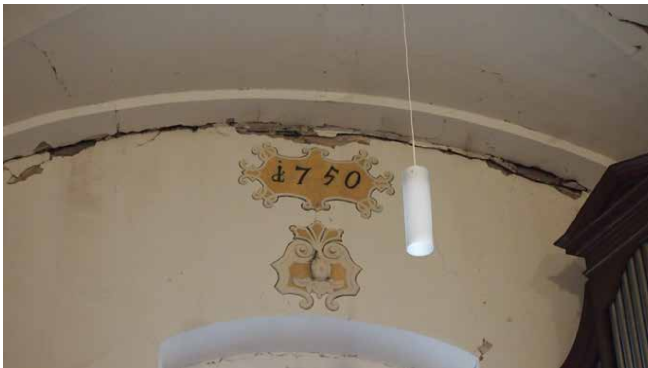
2. Medaljon na pročelnom zidu pjevališta, crkva sv. Marije na Dolcu Medallion on the front wall of the choir, St Mary's church in Dolac

pana Matkovića, kada je crkva obijeljena i probijeni su novi prozori. Potres 1880. godine ošteti je sve zagrebačke crkve, posebno katedralu, no crkva na Dolcu ostala je u funkciji i služila kao katedralna crkva u razdoblju od 1880. do 1885. godine. 30 I 140 godina poslije situacija se ponovila, u potresu 22. ožujka 2020. oštećene su sve crkve u središtu Zagreba i privremeno su zatvorene, a crkva na Dolcu jedina je crkva podignuta prije 20. stoljeća u centru grada koja je otvorena i u funkciji, iako i sama teško oštećena (sl. 3). 31