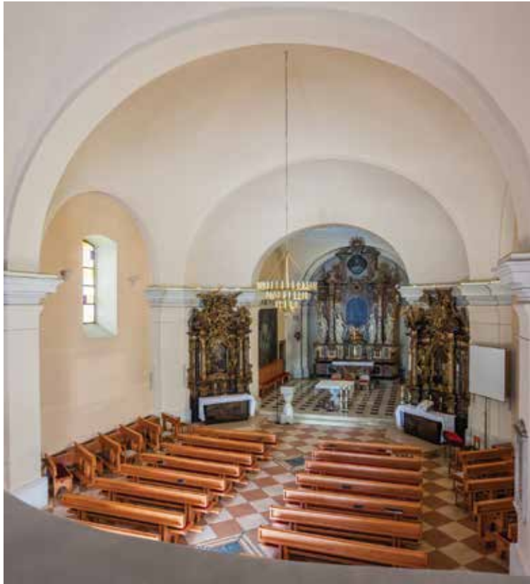
6. Unutrašnjost crkve sv. Franje Ksaverskog (Fototeka Instituta za povijest umjetnosti)

Interior of the church of St Francis Xavier