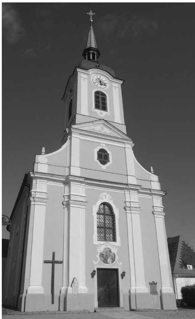
12. Pročelje župne crkve u Stubenbergu, Austrija Front façade of the parish church in Stubenberg, Austria

njegovom bogatom opusu, primjerice sa župnom crkvom u Stubenbergu, Štajerska, građenom 1760. – 1766. godine. 59 U njoj je, u manjem mjerilu i jednostavnijim sredstvima, ostvarena ideja sceničnosti i snažna centralizacija longitudinalnog