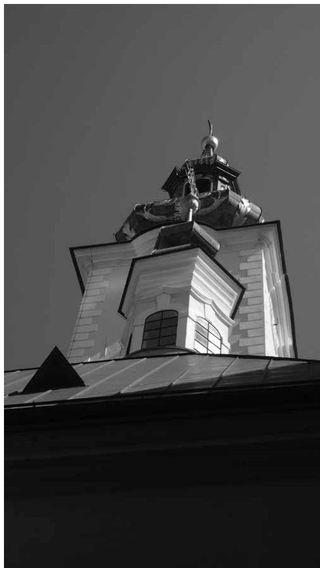
10. Lanterna na kupoli svetišta crkve na Dolcu Lantern in the sanctuary dome of the church in Dolac

kutom postavljene pilastre bočnih polja, a tu kretnju prati bogata profilacija gređa koje se na njih oslanja te kapiteli oblika stiliziranih odlomaka gređa s jastučasto oblikovanim frizom, čime je potenciran dojam krivulje, posebno u zoni gređa, odnosno istaknutoga profiliranog vijenca (sl. 8). U gornjem dijelu stilizirane volute sužavaju bočna polja, a na središnjima je trokutasti zabat. Okviri prozora u srednjem te niša u bočnim poljima spojeni su stiliziranim pilastrima s natprozorskim vijencem te ispunjeni motivima polukružnih diskova, a u gornjoj zoni je okulus profiliranog okvira. Crkva predstavlja jedno od najzanimljivijih rješenja sakralne arhitekture 18. stoljeća kod nas, a ističe se i visokom kvalitetom izvedbe, što posebno pokazuje arhitektonska artikulacija te prostorna krivulja u brodu. Još su brojna otvorena pitanja povezana s tom crkvom, pa tako i autorstvo i podrijetlo rješenja, a u literaturi se naglašavala visoka kvaliteta prostor-