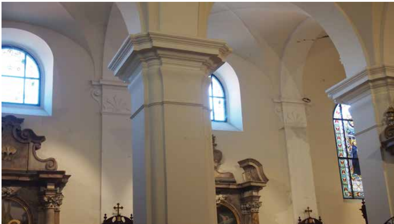
1. Unutrašnjost crkve sv. Marije na Dolcu Interior of St Mary's church in Dolac