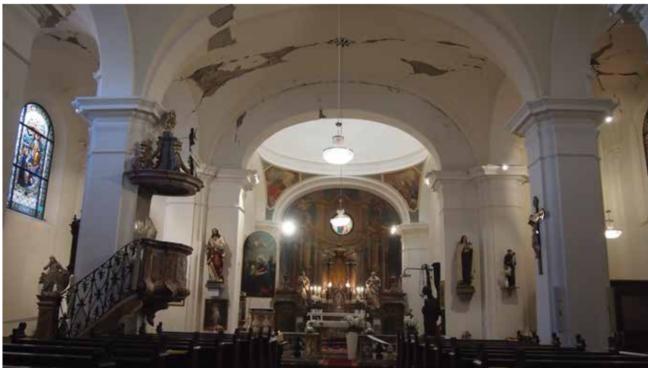
3. Oštećenja na svodu broda, crkva sv. Marije na Dolcu Damage to the vault of the nave, St Mary's church in Dolac

šesterostranom lanternom s lukovicom. Lanterna je rastvorena prozorima iznad kojih su trokutasti vijenci spojeni s naglašenim zaglavnim kamenom, bogato profilirani kao i grede pod kapom, s jastučasto nabubrenim frizom.