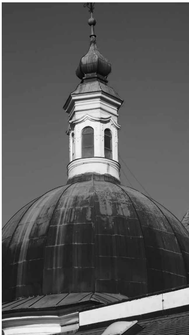
9. Lanterna na kupoli svetišta crkve sv. Franje Ksaverskog, Zagreb Lantern in the sanctuary dome of the church of St Francis Xavier, Zagreb