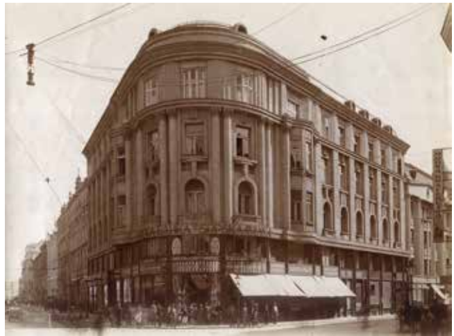
1. Arhitektonski atelijer Benedik & Baranyai, Poslovno-stambena zgrada Srpske banke, Jurišićeva 4, Zagreb, 1912. – 1914. (privatna zbirka, Zagreb)

Odavno je uočena sklonost zagrebačkih arhitekata s početka 20. stoljeća mirnim neoklasicističkim oblicima koje s(p)retno spajaju s trendovima epohe. 26 Uzroke takvoj sklonosti treba prije svega tražiti u okolnostima njihova formiranja: u mjestu obrazovanja, odnosno u recepciji dominantnih utje-