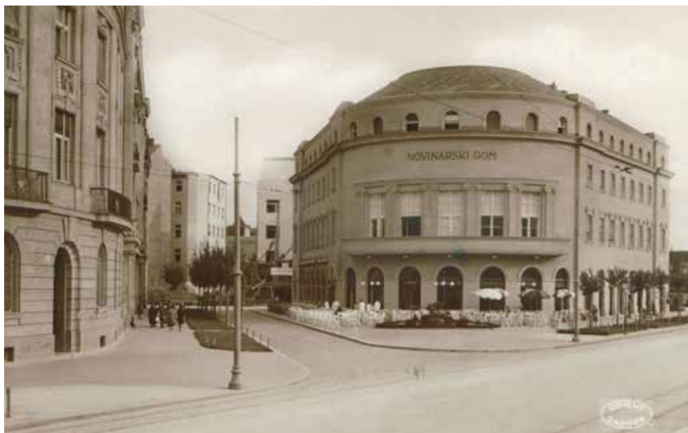
11. Bruno Bauer, Novinarski dom, Perkovčeva 2, Zagreb, 1928. – 1929. (Muzej za umjetnost i obrt, Zagreb) Bruno Bauer, House of Journalists, Perkovčeva 2, Zagreb, 1928–1929