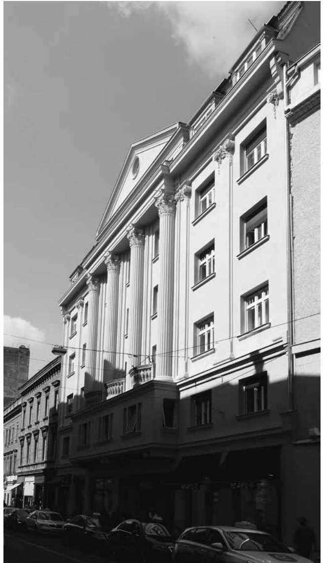
10. Srečko Florschütz, Stambeno-trgovačka zgrada Müller, Masarykova 10, Zagreb, 1924. – 1925.

Srečko Florschütz, Commercial and apartment building Müller, Masarykova 10, Zagreb, 1924–1925