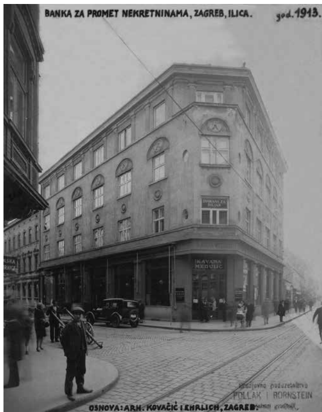
4. Arhitektonski atelijer Kovačić & Ehrlich, Stambeno-trgovačka zgrada Banke za promet nekretninama, Medulićeva 2, Zagreb, 1913. (Muzej za umjetnost i obrt, Zagreb)

Architectural studio Kovačić & Ehrlich, Commercial and apartment building of the Bank for Real Estate Transactions, Medulićeva 2, Zagreb, 1913