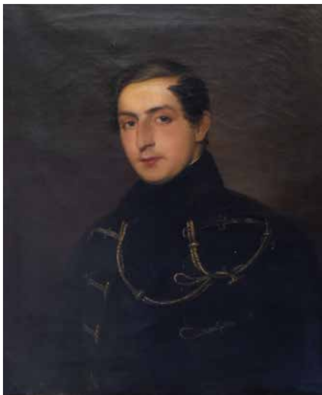
6. József Borsos, Adolf grof Pejačević, oko 1850., ulje na platnu, 100 × 83 cm, Zbirka Mihalović, Zagreb

József Borsos, Adolf Count Pejačević, around 1850, oil on canvas, 100 × 83 cm, Mihalović Collection, Zagreb