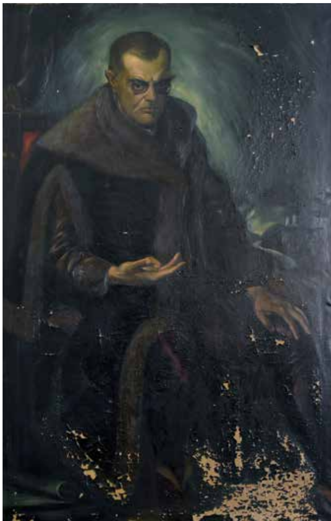
8. Maksimilijan Vanka, Antun pl. Mihalović, 1924., ulje na platnu, 170 × 110 cm, Zbirka Mihalović, Zagreb

Maksimilijan Vanka, Antun pl. Mihalović, 1924, oil on canvas, 170 × 110 cm, Mihalović Collection, Zagreb