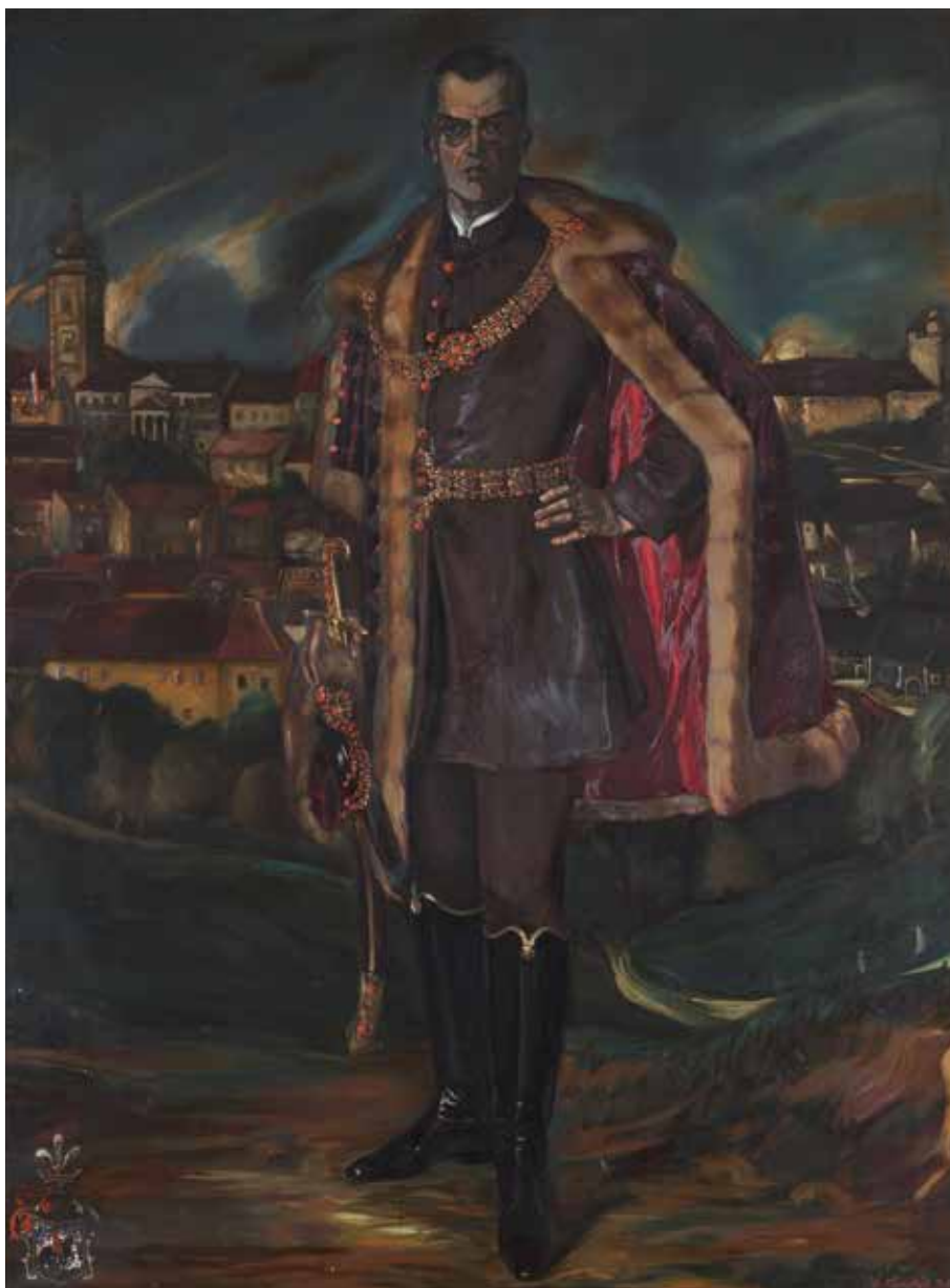
7. Maksimilijan Vanka, Antun pl. Mihalović, 1918., ulje na platnu, 220 × 170 cm, Zbirka Mihalović, Zagreb

Maksimilijan Vanka, Antun pl. Mihalović, 1918, oil on canvas, 220 × 170 cm, Mihalović Collection, Zagreb