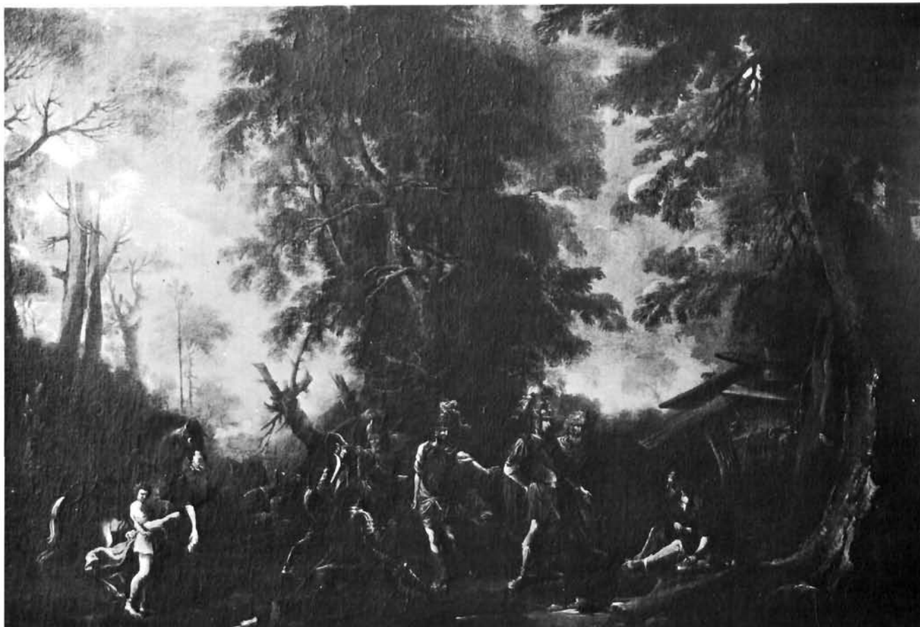
Bartolomeo Pedone, Aleksandar i Diogenes. Zagreb, Strossmayerova galerija