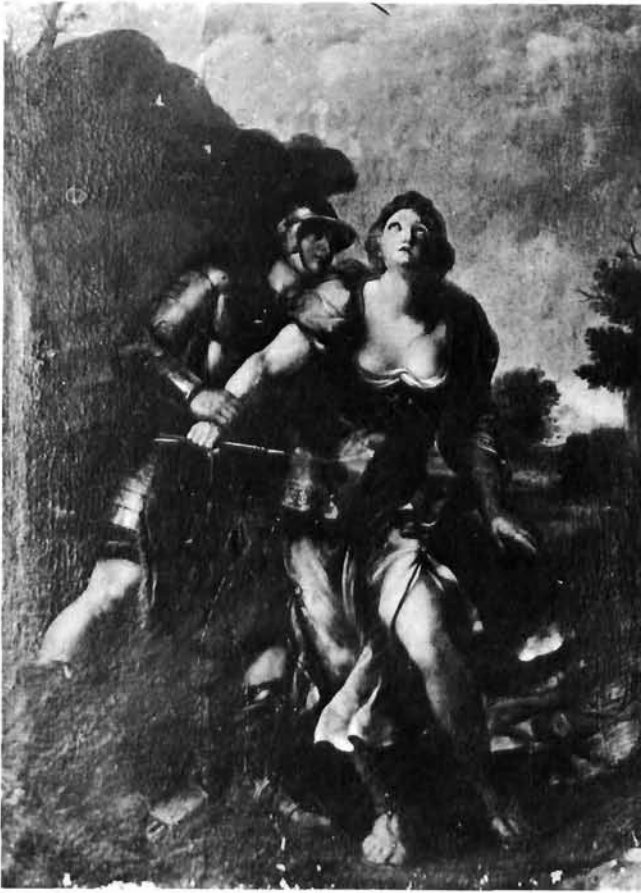
Pietro della Vecchia, Historijski prizor . Vlasnik nepoznat

Strozija). To je bez dvojbe način ponešto labilan u svojim anakronističkim osvrtima, i gotovo uvijek »šaržiran«, u morfologiji, i boji, a osobito u fiziognomici i gestikulaciji. Ta opterećenost i neka pučka, naturalistička težnja prema jakoj ekspresiji pojačava se s vremenom sve više, i često dovodi do jedva podnošljivih situacija. Pa ipak, koliko bi bez njegova velikog opusa bilo siromašnije slikarstvo mletačkog seicenta! Pietro della Vecchia daje mu naglasak burleske i pučkog karaktera, dovodeći taj karakter čak do paroksizma. 2