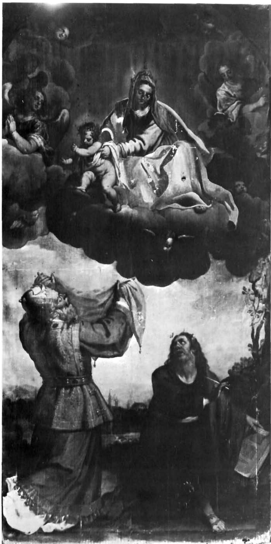
Felice Brusasorci, Bogorodica sa sv. Ivanom Evanđelistom i biskupom. Rab, župna crkva