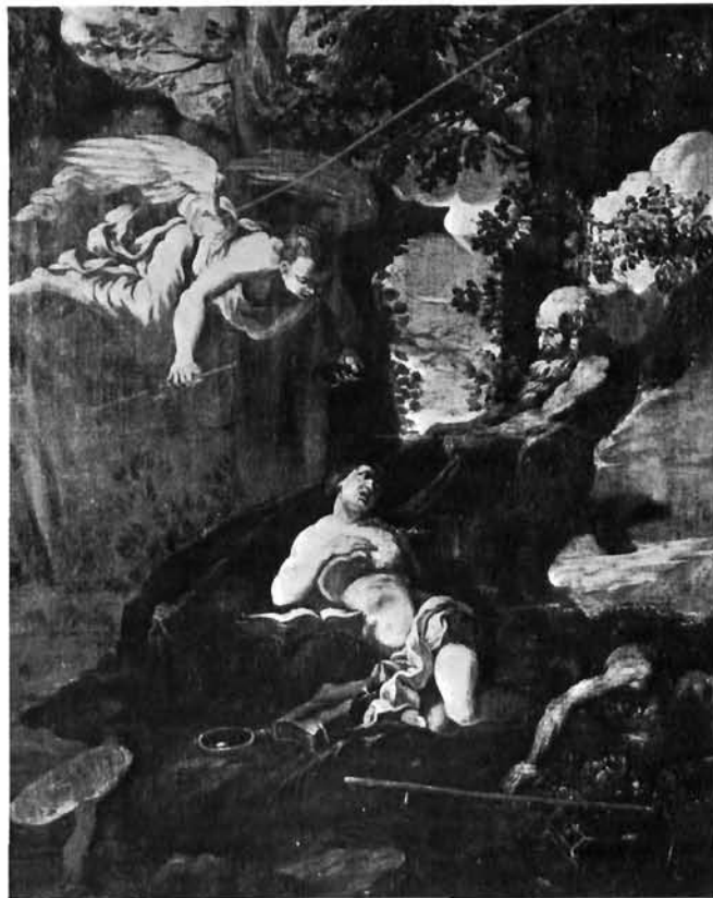
Francesco Cozza, Vrijeme otkriva Istinu , detalj. Mali Lošinj, Gradski muzej