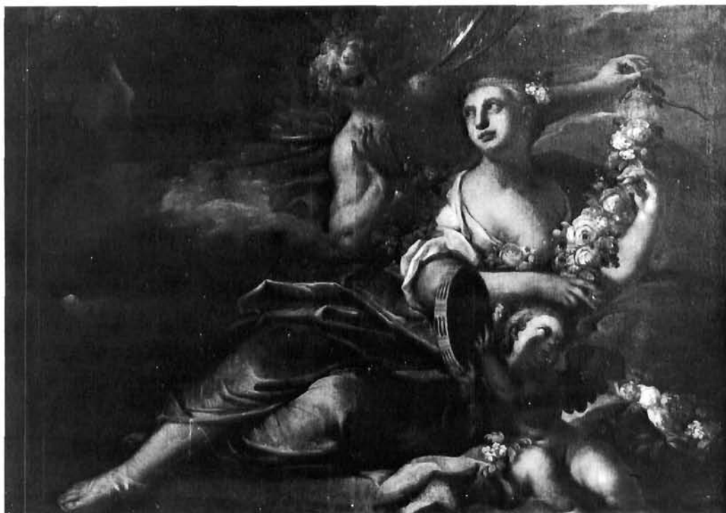
Valentin Lefevr (?), Zefir i Flora . Zagreb, zbirka Novak