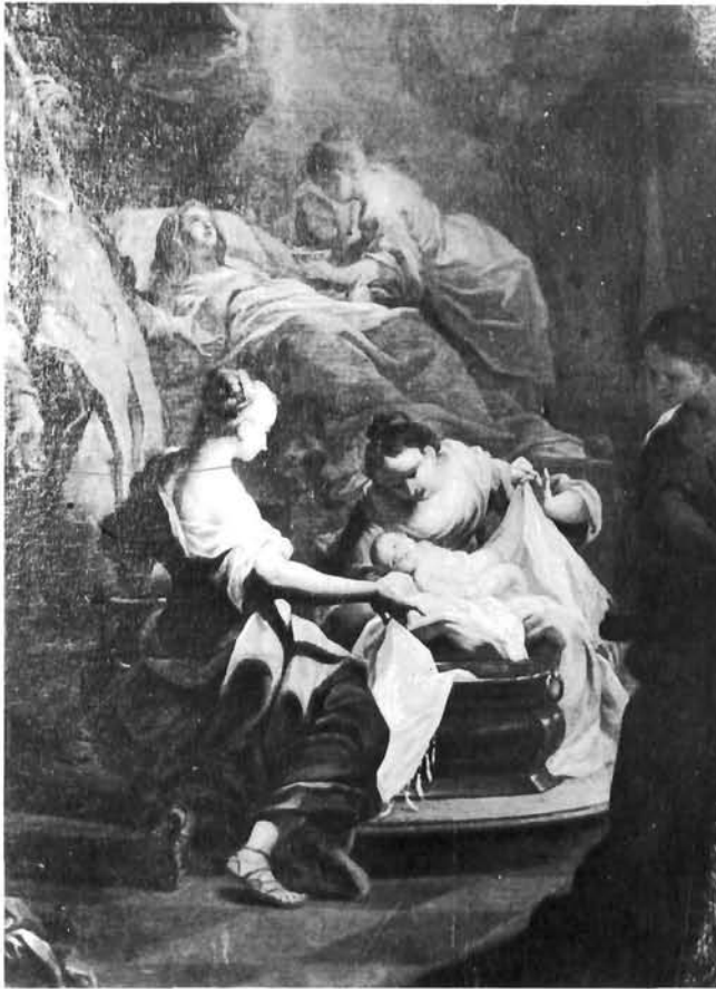
Claudio Ridolfi (?), Rodenje Marije. Vlasnik nepoznat