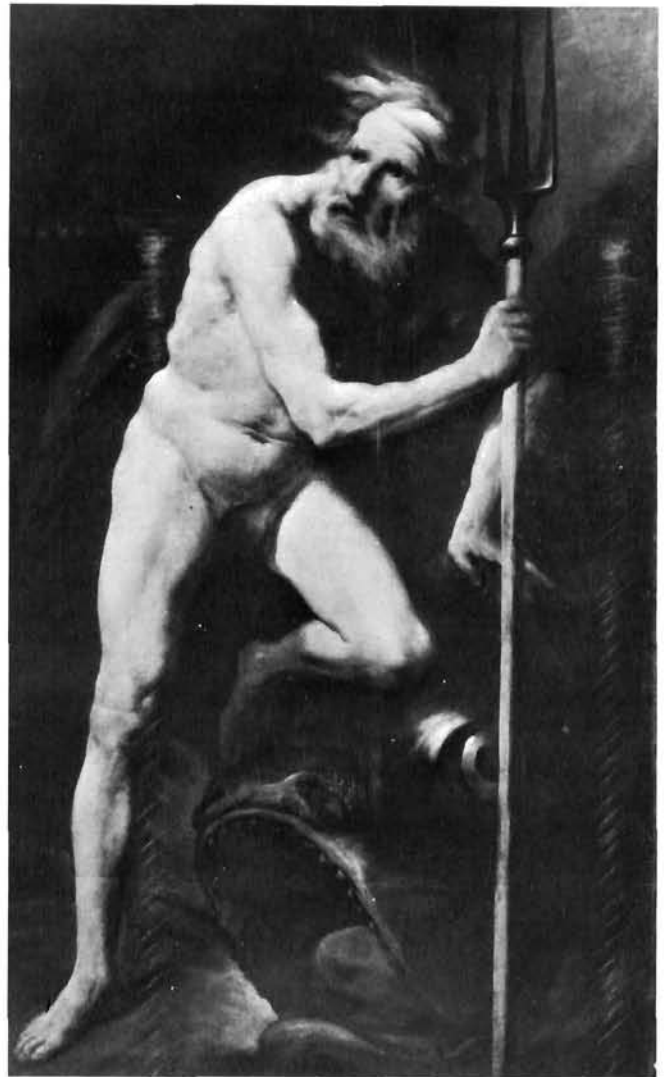
Pietro della Vecchia, Neptun . Split, zbirka J. Jeličić

Mnogo značajnijim i, svakako, sigurnijim prilogom katalogu ovog slikara čini mi se »Neptun« (192 × 116 cm). Ta je velika slika nekad bila na tržištu u Grazu, a danas je u zbirci J. Jeličića u Splitu. Veliki akt morskog boga s trozu-