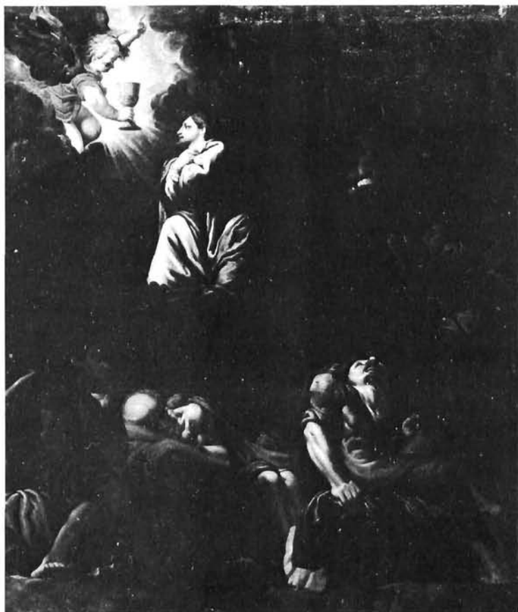
Pietro Bernardi (?), Molitva na gori . Rijeka, Povijesno-pomorski muzej