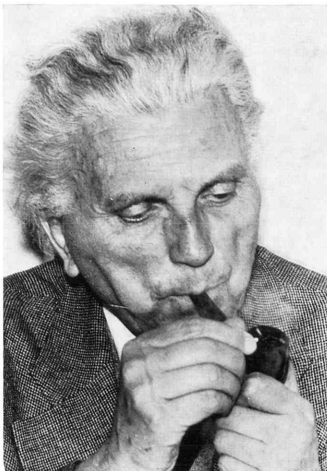
u spomen zlatku šulentiću 1893–1971