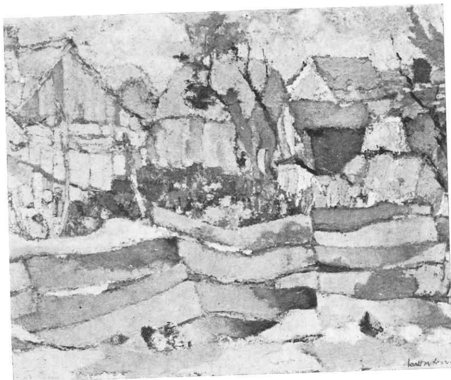
kralj-medimurec planjke, 1957/58.