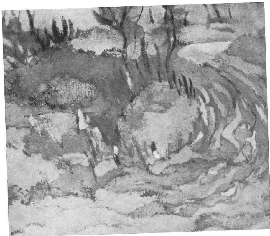
kralj-medimurec omunikacione šare, 1960.